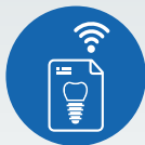
ZI LIVE CASE PRESENTATIONS