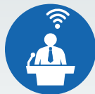
ZI LIVE WEBCASTS