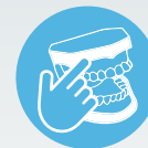
ZI IMPLANT SKILLZ* SERIES