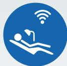
ZI LIVE CLINICAL

Bitte kontaktieren Sie uns für zusätzliche Informationen zu den folgenden Ausbildungsmöglichkeiten: